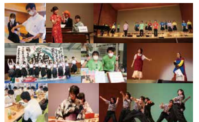
【文化局】 演劇部/書道部/美術部(含イラスト部門)/写真部/吹奏楽部/音楽部/茶道部/自然科学部/琴曲部/ダンス部/囲碁将棋部/文芸部/国際教養部(前ESS部) 【特別局】放送部/新聞部