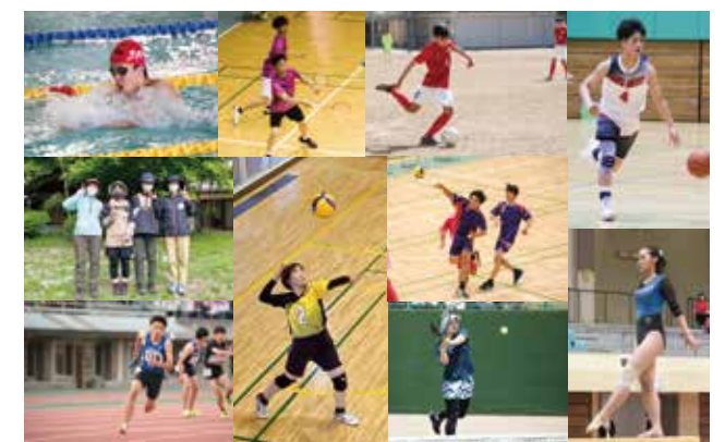
【体育局】 陸上部/ソフトテニス部(男・女)/テニス部(男・女)/野球部/サッカー部/体操部/ハンドボール部(男・女)/バレーボール部(男・女)/バスケットボール部(男・女)/バドミントン部(男・女)/卓球部/弓道部/柔道部/剣道部/山岳部(含スキー部門)/水泳部