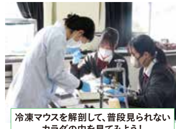
冷凍マウスを解剖して、普段見られないカラダの中を見てみよう！