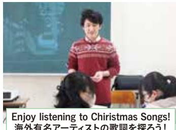
Enjoy listening to Christmas Songs! 海外有名アーティストの歌詞を探ろう！