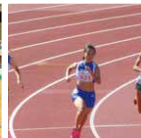
陸上部 関東新人大会出場