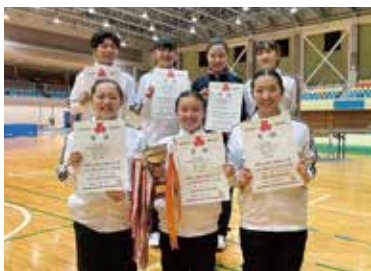
体操部 新人戦女子団体1位、男子団体3位