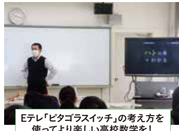
Eテレ「ピタゴラスイッチ」の考え方を 使ってより楽しい高校数学を！