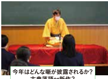
今年は何んな斬が披露されるか？ 古典落語or新作？

西高の土曜講座では、生徒の学力を伸ばすために各教科で講義や演習が行われています。12月には特別編として、本校の先生方がそれぞれ教科書の枠を超えたオリジナルの授業を行うことに加えて、今年度は本校の卒業生で現役の大学院生にも授業を担当してもらい、学ぶことの楽しさや探究することの喜びを紹介してくれました。