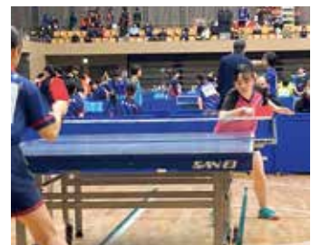
卓球部 関東新人卓球大会出場