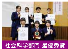
社会科学部門 最優秀賞