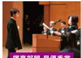
揮毫部門 最優秀賞