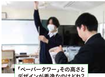
「ペーパータワー」その高さ とデザインが秀逸なのはどれ？