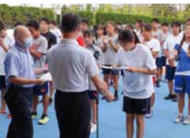
水泳部 学年別大会1年次女子総合優勝

体育局の部活動では、夏季を中心に学年別大会、秋～冬にかけて新人戦の季節がやってきます。2年次生たちを中心に、「自分たちの部活動」としてチームを引っ張る頼もしい姿を見せてくれています！