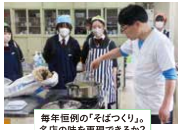
毎年恒例の「そばつくり」。 名店の味を再現できるか？