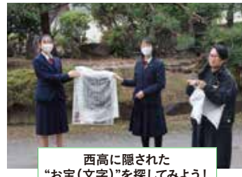
西高に隠された "お宝(文字)"を探してみよう！