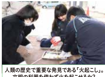
人類の歴史で重要な発見である「火起こし」。 文明の利器を使わず火を起こせるか？