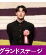
グランドステージ